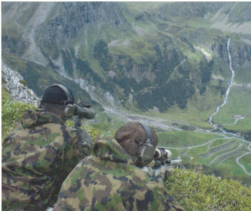
Das Armee-Aufklärungsdetachement 10 stellt hohe Anforderungen an die Kämpfer.

Auf seinem Winterspaziergang äusserte Bundesrat Ueli Maurer die Idee, das Armee-Aufklärungsdetachement 10 solle nicht mehr im Ausland, sondern in der Schweiz selber eingesetzt werden.