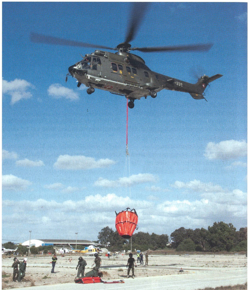
Ein Schweizer Helikopter im Löscheinsatz bei Haifa. Es ist der Cougar T-332.

Der Überflug der Helikopter via Athen gestaltete sich ebenso problemlos wie die Eingliederung des Schweizer Teams in die internationale Operation. Insgesamt standen 37 Schweizer Armee- und DEZA-Angehörige im Einsatz: Zehn Piloten, 13 Me-