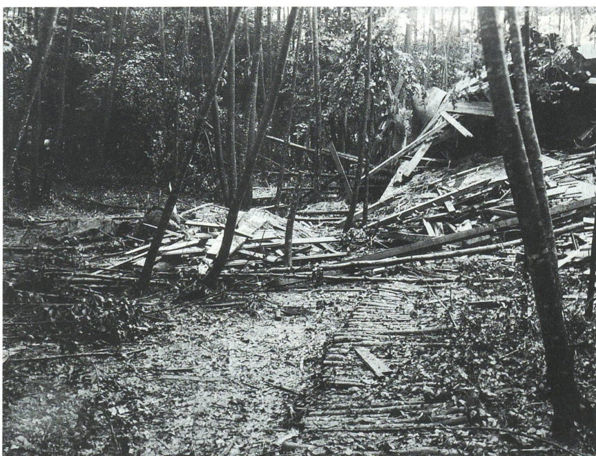
Aufnahme von der Unfallstelle in westlicher Richtung.

Nach Würdigung aller vorliegenden Punkte und vor allem der Tatsache, dass eine genaue Rekonstruktion des Unfallhergangs nicht mehr möglich war, befand das Militärgericht der 6. Division alle Angeklagten als nichtschuldig. Sie wurden freigesprochen. +