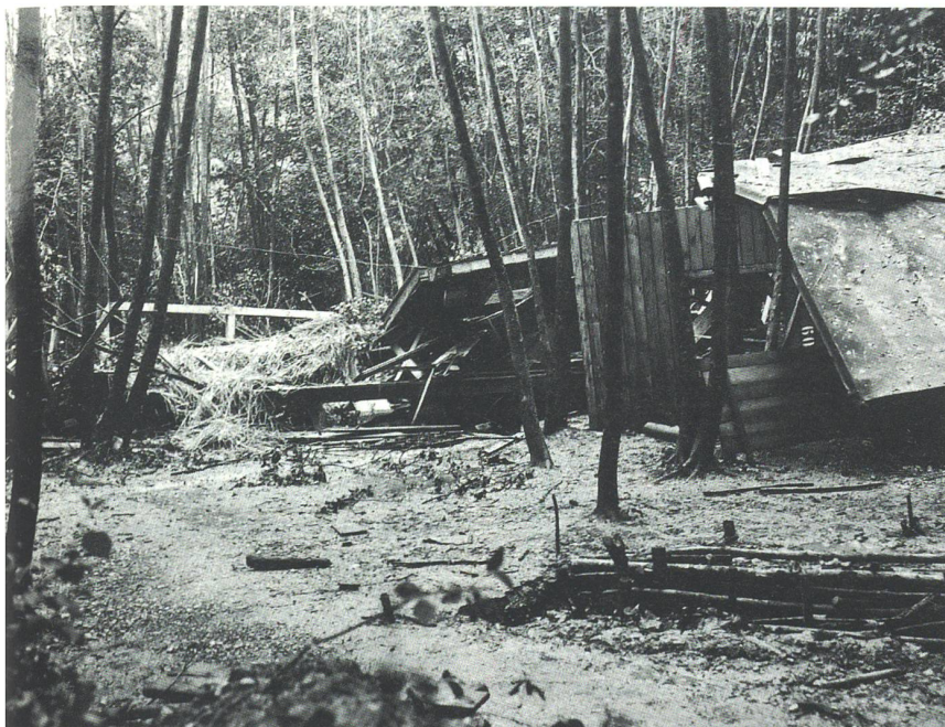
Aufnahme von der Unfallstelle in nördlicher Richtung.

men und weitergegeben worden. Überwachung und Einlagerung der Minen war Sache der jeweiligen Kompanie.