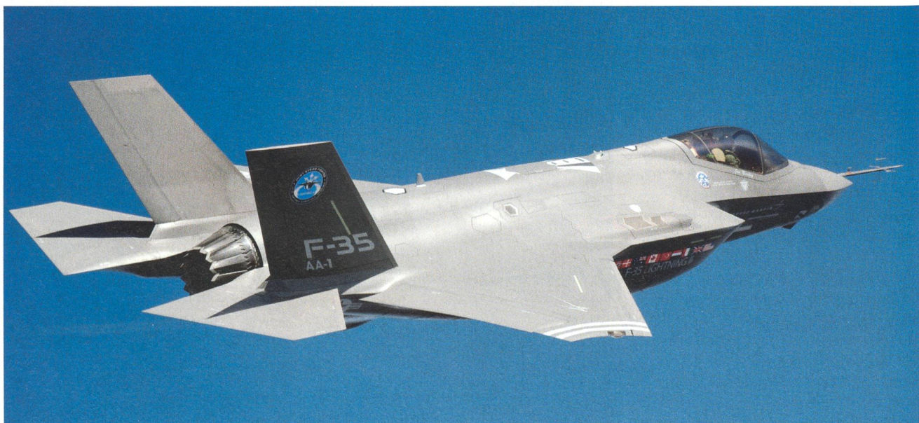
Der Autor Knöri verlangt, dass die Schweizer Luftwaffe in einer künftigen Ausmarchung auch den Amerikaner F-35 evaluiert.