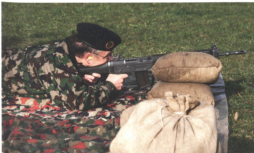
Zielsicher: Brigadier Martin Vögeli, der Kommandant Infanteriebrigade 7.

Die durchschnittliche Laufzeit betrug 23 Minuten. Ehrengast Brigadier Martin Vögeli liess es sich nicht nehmen, selber Hand anzulegen und den Schiesswettkampf sowie das UWK-Werfen zu bestreiten. Gewertet wurden die Resultate zwar ausser Konkurrenz, es darf aber gesagt werden, dass der Kommandant der Infanteriebrigade 7 eine Platzierung in den vorderen Rängen erzielt hätte. ah. ☐