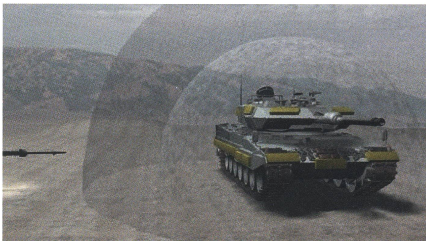
Die Funktion von ADS: Links sichtbar ist ein Geschoss. Auf der äusseren Halbkugel wird das Geschoss erfasst und bei der inneren Halbkugel unschädlich gemacht.

Das geschützte Fahrzeug ist rundherum mit Sensoren ausgestattet. Sie erfassen und erkennen das anfliegende Geschoss in neun Metern Entfernung und lösen den Abwehrmechanismus aus. Das Abwehrsystem ist in der Lage, gleichzeitig mehrere Ziele zu bekämpfen.