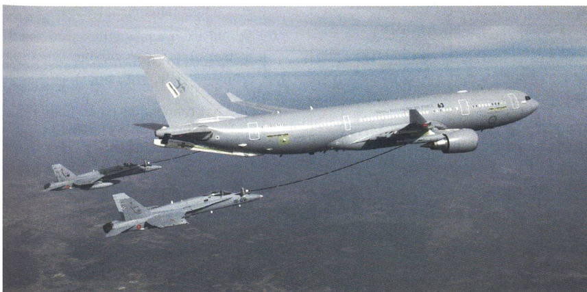
Ein Airbus KC-45 versorgt zwei F-18 Kampfflugzeuge. Mit dem digitalen 905E Auf-tanksystem können pro Minute rund 1700 Liter Treibstoff abgegeben werden.

Der Exekutivdirektor von EADS, der Franzose Louis Gallois, und die EADS-Vertreter in den USA erwarten von den US-Behörden eine saubere Begründung des Entscheides. Davon hängt es in den ersten Märztagen ab, ob EADS gegen den Entscheid rekurrieren wird. +