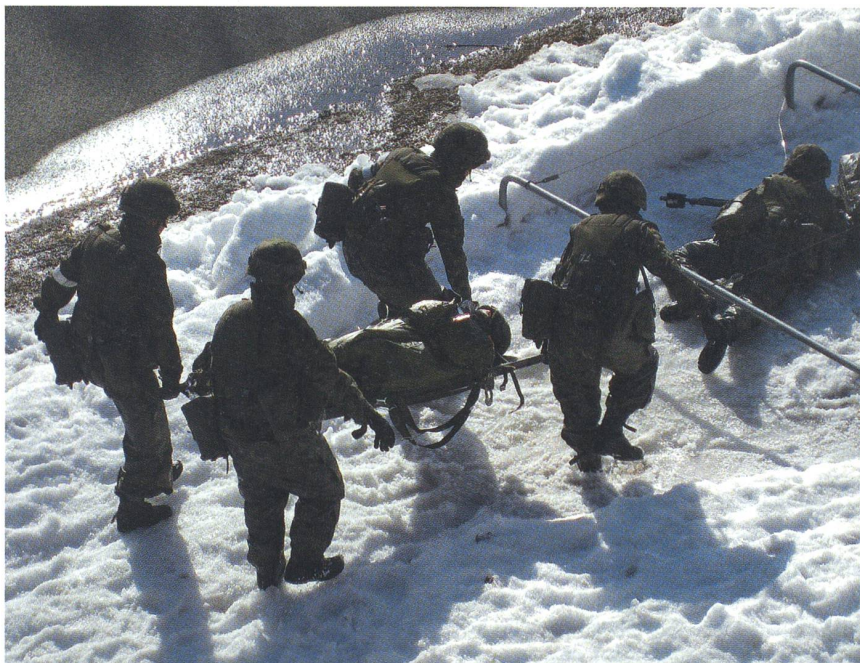
Ein Arbeitgeber von unschätzbarem Wert: In der Leventina kann niemand den Waffenplatz Airolo und die Sanitätsschulen ersetzen (hier der Parcours für die Rekruten).

Die Liste liesse sich beliebig verlängern – um die Kantone Schaffhausen, St. Gallen,