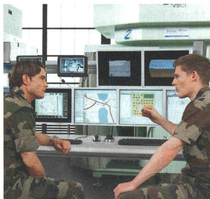
International im Geschäft.