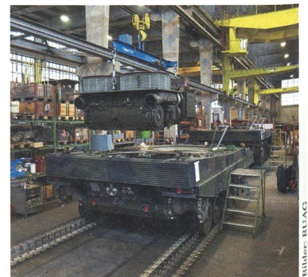
In einer RUAG-Werkhalle.