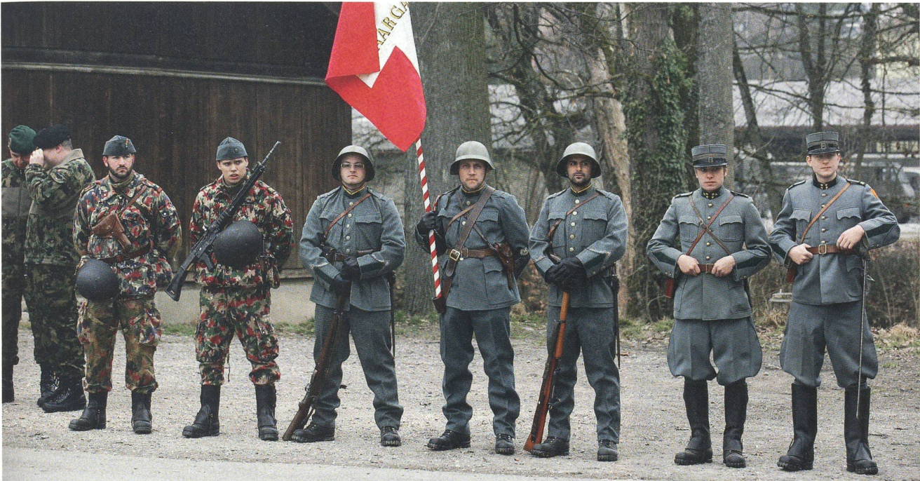
Die lebendige Darbietung der historischen Uniformen der Infanterie stiess auf grosses Interesse. Ausrüstung, Uniformen und die Fahne des alten aargauischen Füsilier Bataillons 56 – alles stellte das Zeughaus Aarau zur Verfügung. Von rechts zwei Offiziere in der Uniform Ordonnanz 1940, Fahne und Fahnenwache in der Ordonnanz 1926 und zwei Mann im alten Kämpfer.