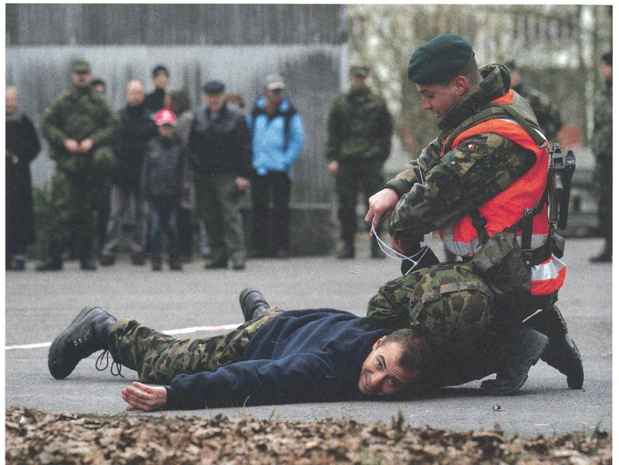
Festnahme: Das «Opfer» nimmt's für einmal gelassen.

Für alle mit geschichtlichem Flair werden Uniformen und die entsprechende Bewaffnung im Pavillon präsentiert sowie die Geschichte des Inf Bat 56 anhand von Plakaten aufgezeigt. Die Nummer 56 ist in der Infanteriebrigade 5 die einzige Bataillonsnummer, die auf die Truppenordnung von