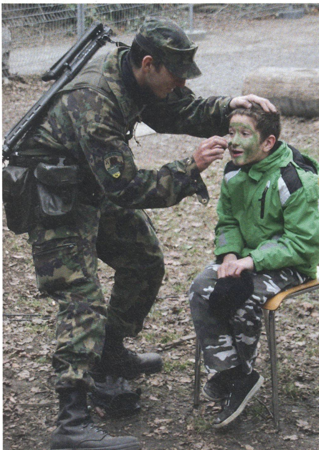
Bei der Inf Kp 56/3 konnten sich die jungen Besucher fachmännisch tarnen lassen.