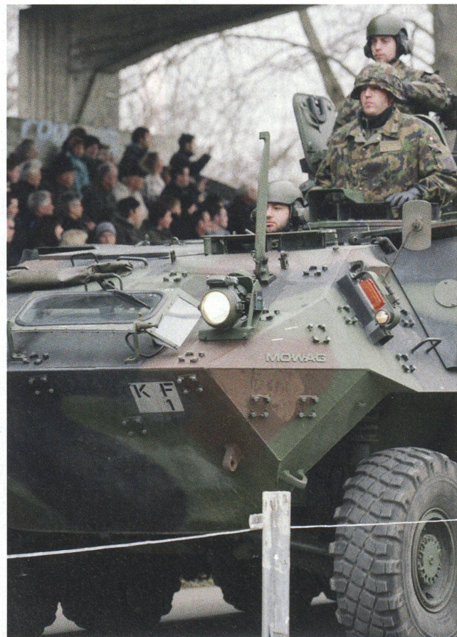
Eines der Hauptwaffensysteme der modernen Infanterie: Der Radschützenpanzer PIRANHA 8x8.