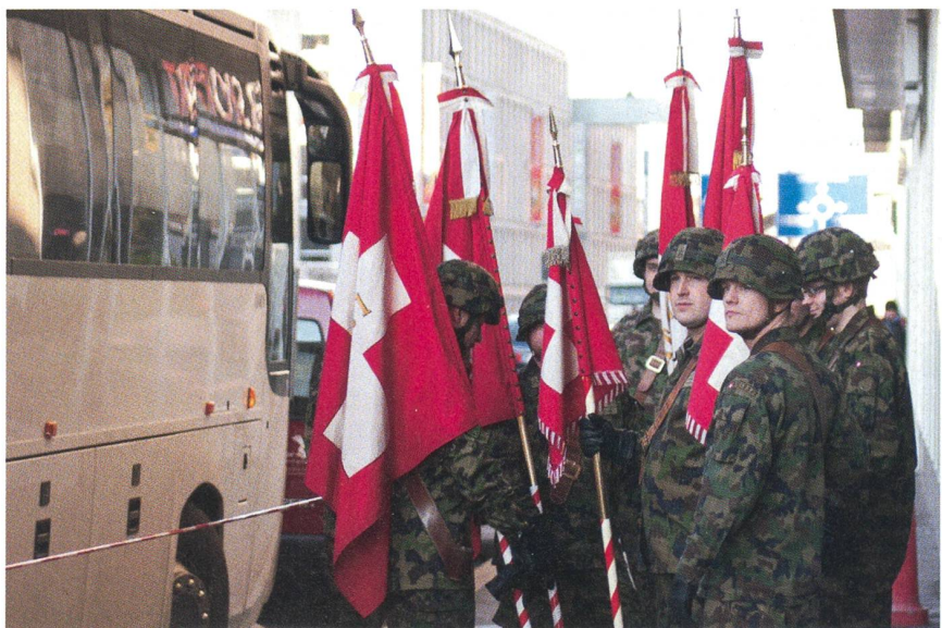
Ein Schnappschuss: Die Fähnriche warten auf den Einmarsch mit ihren Feldzeichen.