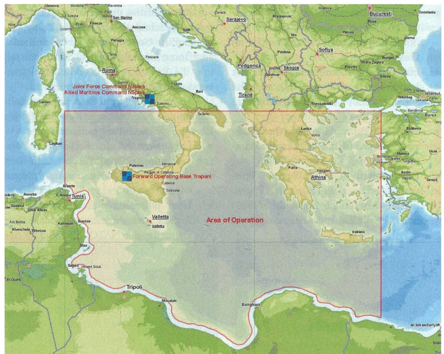
Das von der NATO definierte Gebiet zur Sicherstellung des Embargos gegen Libyen im Mittelmeer. Die Küstenlänge Libyens beträgt zirka 1800 km.

Nur fünf Jahre später flogen amerikanische Kampfflugzeuge der Flugzeugträger USS «Coral Sea», USS «Saratoga» und USS «America» Angriffe gegen libysche Lenkwaffenstellungen und Marineeinrichtungen. Diese Aktionen waren eine Vergeltung für die von Libyen unterstützten terroristischen Anschläge, so unter anderem in der Diskothek «La Belle» in Berlin, bei welchen