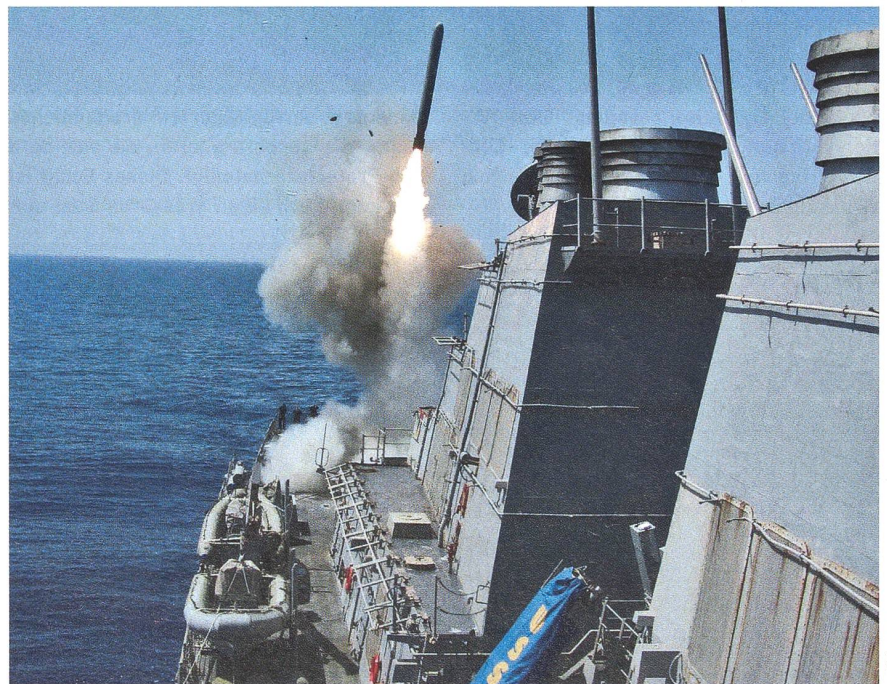
Allein am 29. März 2011 feuerte der Raketenzerstörer USS «Barry» (DDG 52) 22 Marschflugkörper des Typs «Tomahawk» gegen Ziele in Libyen ab. Die Aufnahme zeigt die «Barry» beim Abschuss einer dieser TLAM.

Aus dem gesamten US-Inventar von rund 3200 «Tomahawks» (TLAM) sind mittlerweile gegen 200 gegen Libyen eingesetzt worden, der Raketenzerstörer USS «Barry» hat am 29. März 2011 allein deren 22 abgeschossen. Diese TLAMs sind vor allem gegen Führungseinrichtungen, Flab-Lenkwanstellungen, SCUD Raketenstellungen sowie