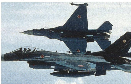
Mitsubishi F-2 im Formationsflug.

Insgesamt sollen 18 Kampfflugzeuge des Typs Mitsubishi F-2 der 21. Trainingsstaffel zerstört oder beschädigt worden sein, welche zum Zeitpunkt des Bebens in Matsushima stationiert war. Die F-2 gleicht auf den ersten Blick der amerikanischen F-16, aus welcher sie auch um einiges weiterentwickelt und angepasst wurde, so dass von einem eigenen Flugzeugtyp gesprochen wird. Der Rumpf der F-2 ist länger, die Kunststoff-Tragflächen sind um einiges grösser und eine komplette Neuentwicklung. Das Mehrzweckradar soll eine Reichweite von 190 km haben; die F-2 war das erste Serienkampfflugzeug der Welt, das mit einem AESA-Radar ausgestattet wurde.