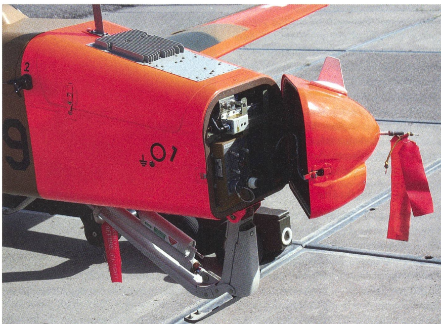
Die ADS-95 – hier ein seltenes Bild der offenen Drohnenspitze – leistet gute Dienste.

Schon im Sommer 2008, während der Fussball-Europameisterschaft, flogen ADS-95-Drohnen zugunsten der Polizei. Die Drohnen gelangten über den verkehrsreichen Austragungsorten zum Einsatz und halfen mit, dass die EURO organisatorisch gut verlief.