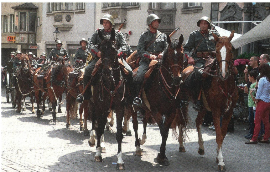
Vorausdetachment mit drei Reitern und 6-spännige 7,5 cm Feldkanone (1903/1922).

Das Feuer kann man nur wirkungsvoll ins Ziel bringen, wenn man die Einschläge beobachten und die Korrekturen mit den entsprechenden Feuerbefehlen zeitgerecht übermitteln kann. Die Ausstellung zeigt