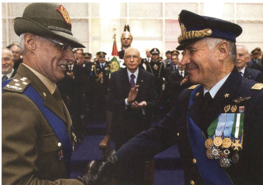
Abrate übernimmt das Amt von General Camporini; in der Mitte Präsident Napolitano.

Neben der Generalstabsausbildung in Civitavecchia holte sich Abrate als Kletterer und Skifahrer höchste Auszeichnungen. An der Universität Turin erwarb er sich den Master in Politologie. In Rom diente er drei