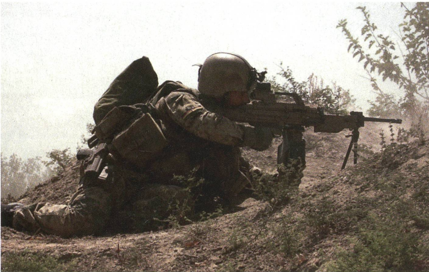
Deutscher ISAF-Soldat beim Kriegseinsatz in Afghanistan.

Rand der Überlegungen gerückt worden. Allerdings weist das neue strategische Konzept der NATO die Landes- und Bündnisverteidigung unverändert als wichtige sicherheitspolitische Aufgabe aus.