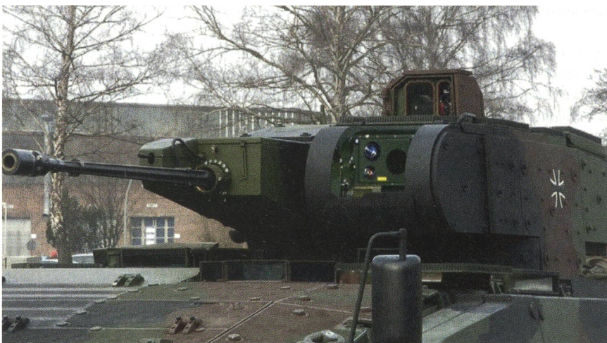
Der Turm des Schützenpanzers PUMA mit der Bordmaschinenkanone.

Selbst die Tatsache, dass fast 50 deutsche Soldaten in Afghanistan ihr Leben verloren haben sowie Hunderte von Soldaten verwundet und traumatisiert worden sind, hat nicht zu einer breiten Erörterung der Sinnfrage geführt.