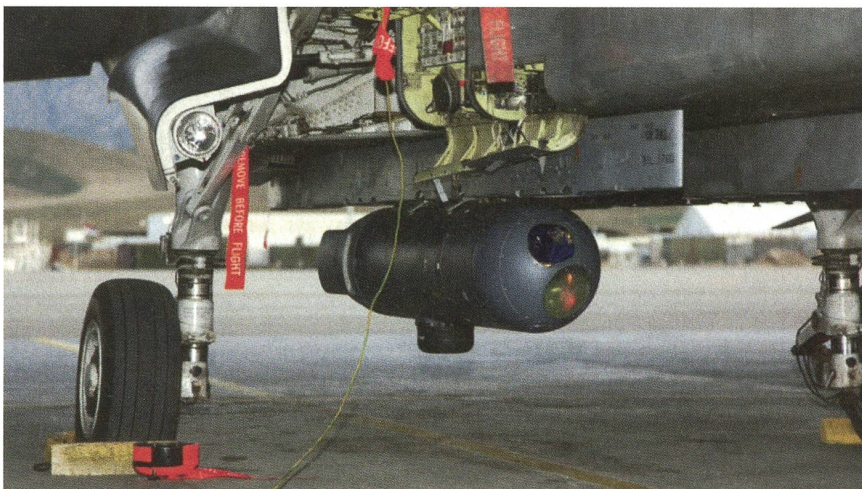
Deutscher Tornado für die Aufklärung mit dem Recce-Lite-Behälter.

Bekannt wurde der «klärende» Spruch des damaligen Verteidigungsministers: «Deutschland wird am Hindukusch verteidigt.» Weder in der Öffentlichkeit noch in den Streitkräften gab es ausreichende grundsätzliche Informationen und Diskussionen.