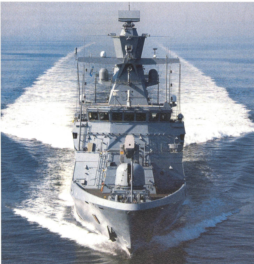
Die Korvette K-130 verschafft der Bundeswehr grössere Flexibilität auf See.

Die Natur- und Nuklearkatastrophe in Japan hat plötzlich die Frage der Energiesicherheit in das Bewusstsein der Deut-