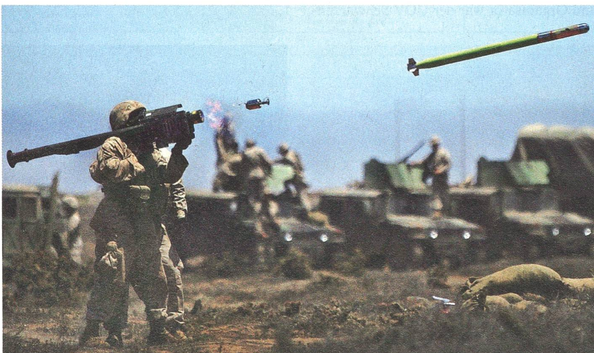
Trainingsabschuss einer «STINGER» durch die US Marine.