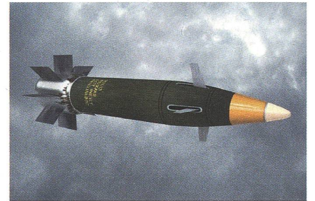
Das Artilleriegeschoss «M982 Excalibur».

Raytheon hat einen Auftrag über 172,6 Millionen US-Dollar zur Lieferung von GPS-gelenkten 155mm-Artilleriegranaten des Typs «M982 Excalibur» erhalten. Insbesondere für die Einsätze in Afghanistan ist die