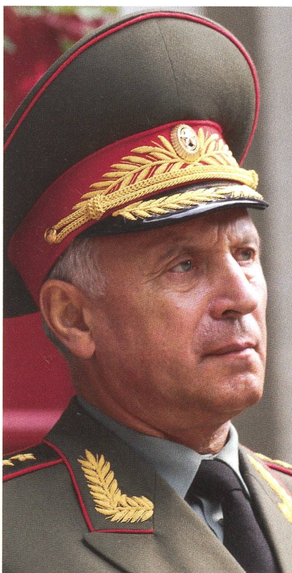
Der russische Generalstabschef Nikolai Makarow besuchte auch den Waffenplatz Andermatt.

Die beiden Brigaden wurden auf den Gebirgskampf ausgerichtet und dementsprechend gerüstet. Vom Auftrag her schauen die beiden Brigaden nach Süden. Sie sollen die russische Südgrenze schützen