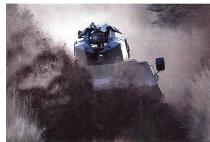
Fernbedienbare Waffenstation TRT 25.

Die slowakischen Streitkräfte haben für ihre gepanzerten Truppentransporter eine neue fernbedienbare Waffenstation gesucht, die das Einsatzspektrum erweitert.