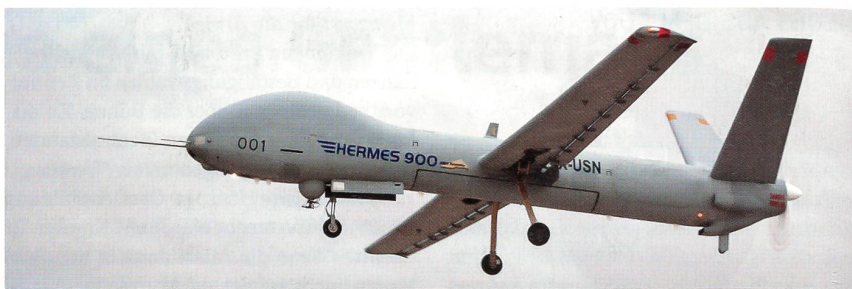
Die neue Mehrzweckdrohne Hermes 900.

Elbit Systems hat die nächste Generation von Multirole MALE (Medium Altitude Long Endurance) UAS (Unmanned Aircraft Systems), die Drohne Hermes 900, entwickelt und dafür bereits erste Kunden in Europa gewonnen. Die neue Mehrzweck-Drohne kann zur Gebietsüberwachung, gezielten Aufklärung und Überwachung, zur elektronischen Aufklärung/Datensammlung, Zielzuweisung, Seeraumüberwachung oder auch zur Bodenunter-