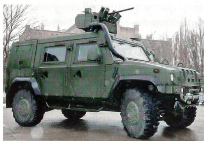
Fahrzeug Iveco LMV M65 Lynx.

Von der grösseren Einkaufsmenge verspricht sich das Militär einen niedrigeren Preis: 16,4 Millionen Rubel (ca. 410 000 Euro) pro Fahrzeug anstatt der derzeitigen 20,3 Millionen Rubel (ca. 507 000 Euro). Mit den Fahrzeugen sollen zehn neue Aufklärungsbrigaden sowie die Luftlande- und Sturmverbände ausgestattet werden. Obwohl die italienischen Fahrzeuge nicht zum Luftlanden geeignet sind und tiefe Wassersperren nicht überqueren können, sollen