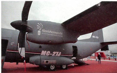
30mm-Geschütz der neuen MC-27J.

Alenia Aermacchi hat anlässlich der Luftfahrtausstellung in Farnborough eine neue Version des C-27 Transportflugzeugs vorgestellt. Die MC-27J ist nicht nur ein Gunship, sondern eine einsatzerprobte Plattform mit bewährter Sensorik, Kommunikations- und Waffensystemen ausgestattet, welches in der Lage ist, eine breite Palette von kundenorientierten Missionen auszuführen. Die MC-27J ist so konzipiert, Luftstreitkräfte und Special Forces bei der Durchführung von mehreren wichtigen Einsätzen, einschliesslich der Unterstützung von Anti-Terror-Missionen, der Evakuierung von Soldaten und Zivilbevölke-