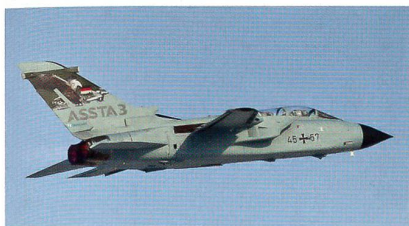
Deutscher Tornado ASSTA 3.0.

Bis 2018 ist die Umrüstung aller 85 im zukünftigen Bestand der Luftwaffe eingesetzten Tornados auf diesen Standard geplant. ASSTA 3.0 beinhaltet neben der Integ-