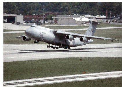
Das US-Transportflugzeug Galaxy.

Im Juli hat Lockheed Martin die fünfte C-5M Super Galaxy der US Air Force übergeben; es handelt sich dabei um die achte umgebaute Galaxy. Bei dem C-5M Super Galaxy handelt es sich um eine mit modernen Triebwerken und zeitgemässer Cockpit Avionik nachgerüstete C-5 Galaxy. Das CF6-80C2 Triebwerk liefert eine um 22 Prozent höhere Schubkraft und führt bei dem