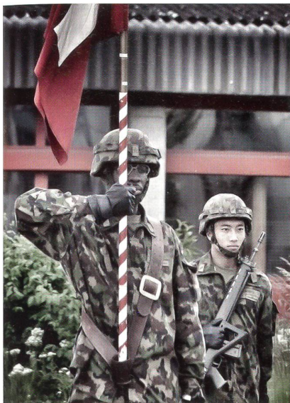
Schweizerfahne in Chamblon.

Dieses Bild verdanken wir unserem aufmerksamen Redaktor Oberstlt i Gst Matthias Müller, der die Szene bei einem seiner Truppenbesuche in Chamblon aufnahm. Kurz und bündig schreibt er dazu: «Integration und Vielfalt». Dem ist wenig anzufügen ausser der Anmerkung, dass die Redaktion