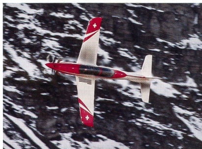
PC-21 in den Alpen.

Die QEAF hat sich nach einer äusserst detaillierten und anspruchsvollen Evalua-