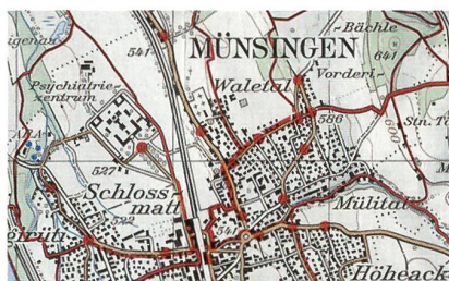
Der Ausschnitt Münsingen 1:50 000.

Bei Swisstopo sind wieder prachvolle Wanderkarten neu erschienen. Es handelt sich dabei um folgende neue Karten mit einer Fülle von Informationen für alle, welche gerne wandern und die Schweiz in all ihren Facetten erkunden: