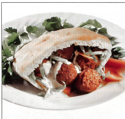
Falafel schmeckt gut.

Die Produkte von Siani Food wie Pita, Falafel, Chumus und weitere orientalische