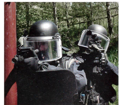
Kämpfer des MP Spez Det im Einsatz.

Die erste Verlängerung lag in der Befugnis des Bundesrats. Die nächste wäre dann wieder Sache des Parlaments.