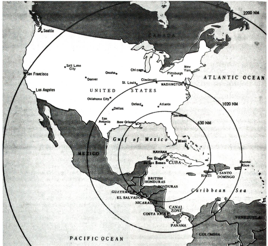
Die Reichweiten der SS-4 und SS-5. Der grössere Radius der SS-5 Skaan mit etwa 3500 km deckt praktisch die ganze USA ab, jener der SS-4 Sandal reicht immerhin bis zur Hauptstadt Washington D.C.

Kennedy stand nach Vorliegen eindeutiger Beweise der Stationierung von sowjetischen Raketen auf Kuba unter massivem Druck. Sein Beraterteam war gespalten. Die einen, Zivilisten und Militärs («Falken»), unter ihnen speziell der Stabschef der Luftwaffe General LeMay, empfahlen eine unverzügliche Ausschaltung der Raketenbasen oder gar eine Invasion.