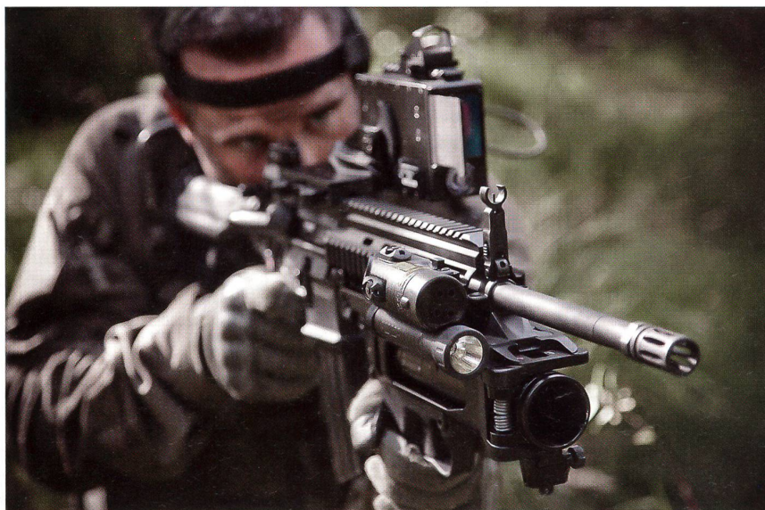
Gut sichtbar ist der am Gewehr angebrachte 40 mm Granatwerfer und die Zielvorrichtungen mit Laser und Lampe.

Mit Skyshield können die Geschosse der 35-mm-Kanone so programmiert werden, dass sie unmittelbar vor dem Ziel explodieren und den Angreifer in der Luft unschädlich machen. Diese Art des Bekämpfens auf relativ kurze Distanz ist kosteneffizienter als zum Beispiel der Ab-