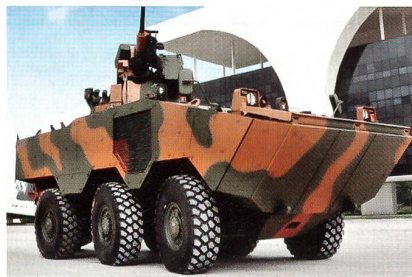
Radschützenpanzer Iveco-6x6-Guarani der brasilianischen Streitkräfte.

Seit 2009 ist Iveco vom brasilianischen Heer beauftragt, 2044 amphibische und geschützte Trabsportfahrzeuge zu liefern. Der 6x6 Guarani ist eine 18-Tonnen-Plattform für eine elfköpfige Besatzung, angetrieben von einem Dieselmotor mit automatischem Getriebe. Das Fahrzeug ist mit Flugzeugen