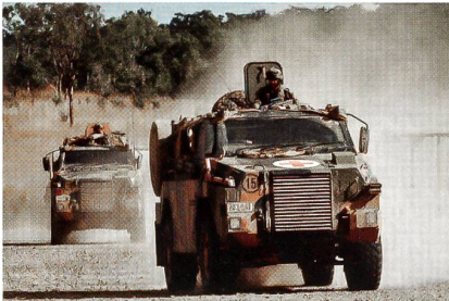
Geschütztes Fahrzeug Bushmaster der australischen Streitkräfte.

Die australische Regierung hat angekündigt, 214 weitere Bushmaster für das Heer zu beschaffen. Thales Australia wird die geschützten 4x4-Fahrzeuge ausliefern. Die Ende der 90er-Jahre erstmals eingeführten Bushmaster wiegen rund 12,5 Tonnen und