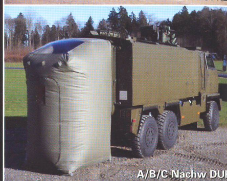
A/B/C Nachw DUF

GENERAL DYNAMICS European Land Systems-Mowag