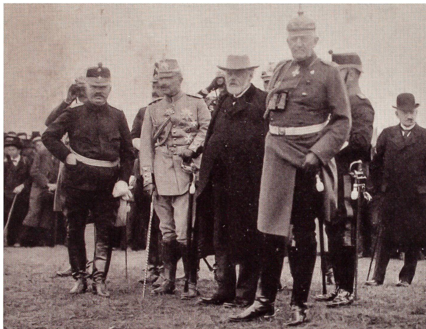
Kaiser Wilhelm II. (2. von links) beobachtet die Manöver.

Diese beschäftigt die Frage, ob im Kriegsfall französische Truppen unter Verletzung der Schweizer Neutralität nach Süd-