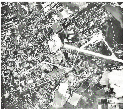
Luftaufnahme vom 21. Dezember 1972 nach einer Bombardierung des Militärflugplatzes Bac Mai 3 km SSW bei Hanoi.