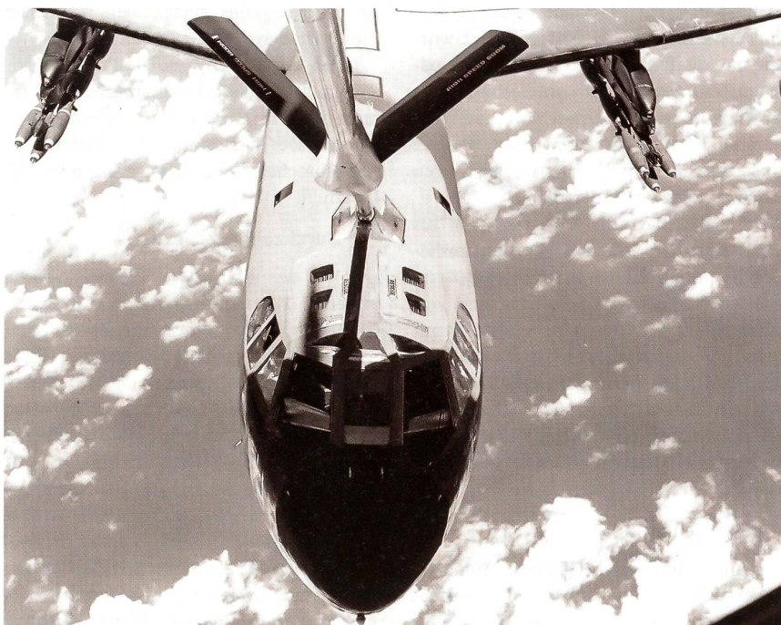
Ein B-52-Bomber wird durch eine KC-135A luftbetankt. An den Aussenstationen führt der Bomber Mk 82 Bomben mit.

Die B-52 aus Thailand brauchten für ihre etwa dreistündigen Einsätze in der Regel keine Luftbetankung, die B-52 aus