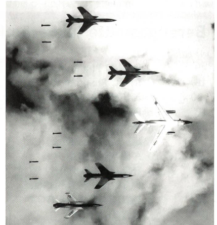
Hier bombardieren vier F-105G Thunderchiefs, unterstützt von einer EB-66 Destroyer, nordvietnamesische Ziele.