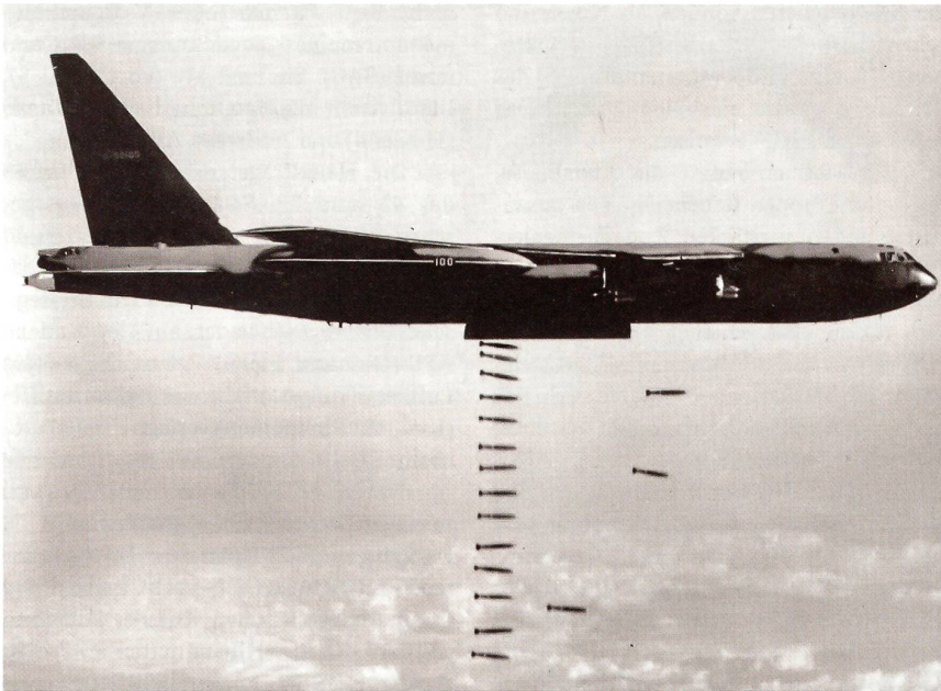
Eine B-52D wirft ihre Bombenlast über einem Ziel in Nordvietnam ab. Diese Version der B-52 konnte 66 bis 108 Bomben der Typen Mk 117 und Mk 82 mitführen.