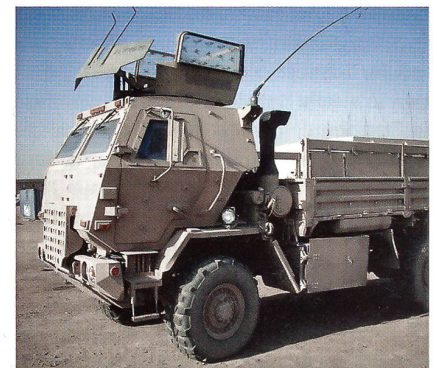
Geschützter Geländelastwagen des Herstellers Oshkosh Defence.

Oshkosh Defence hat in zwei Jahren Vertragsdauer 10 000 Fahrzeuge der Kategorie «Taktischer LKW» ausgeliefert. Die Fahr-