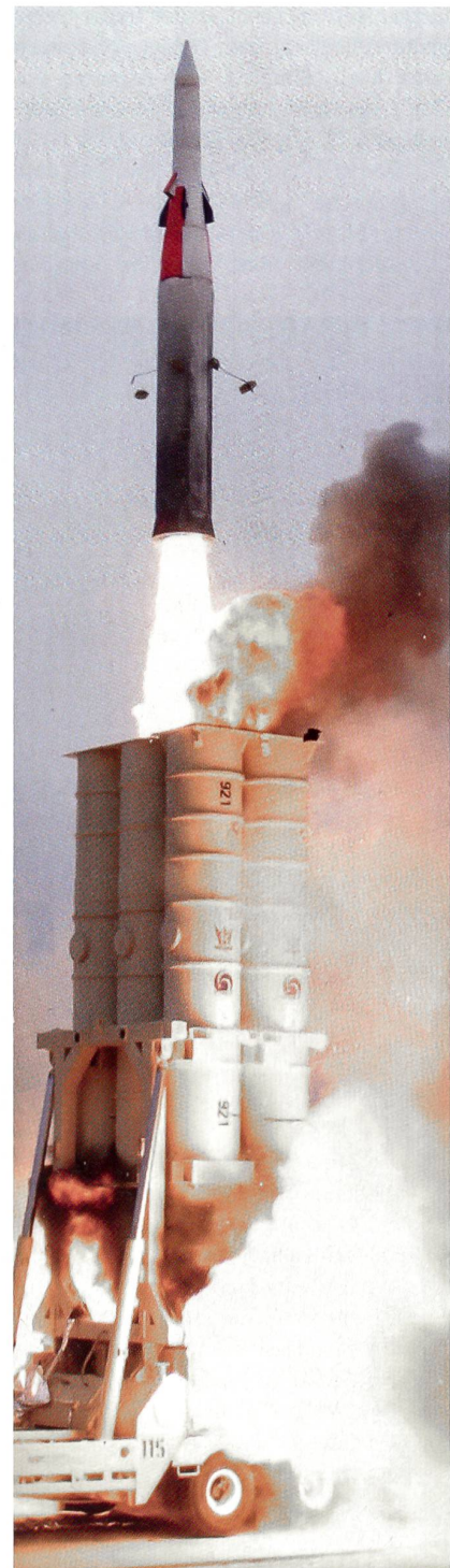
Start einer israelischen Arrow-Rakete. Israel und die USA erlitten einen Rückschlag, als die Iraner eine Sentinel-Drohne abfingen. Womöglich wurde das GPS-Signal gejammt oder gar gespoof. Sollte sich das bewahrheiten, wären israelische und amerikanische Bunkerbuster, JDAM-Waffen, aber auch die neuen MOP gefährdet; alle sind GPS-gesteuert.

Einen Erfolg erzielte die iranische Fliegerabwehr am 4. Dezember 2011 gegen eine amerikanische Aufklärer-Drohne vom Typ RQ-170 Sentinel. Dank moderner elektro-