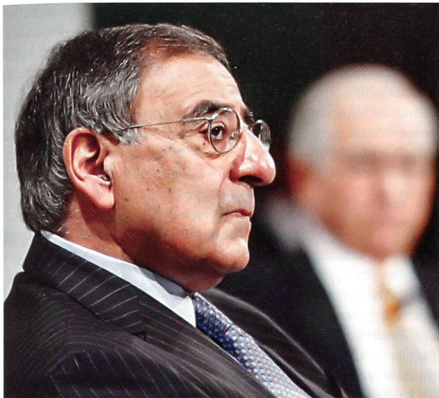
Ein aufmerksamer Zuhörer: Leon Panetta, Chef des Pentagons.