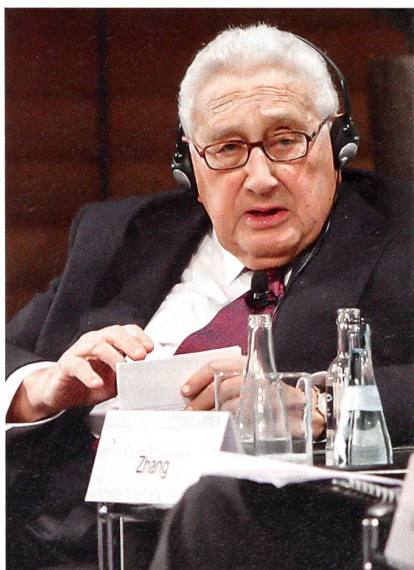
Rüstig mit 89 Jahren: Henry Kissinger.