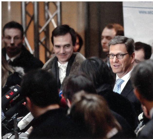
Aussenminister Westerwelle stellt sich den Korrespondenten.

Hof. Die Staatssekretärin suchte ihren russischen Widerpart in Anbetracht der Hiobsbotschaften aus Homs zum Einlenken und einer schnittigen Resolution zu bewegen.