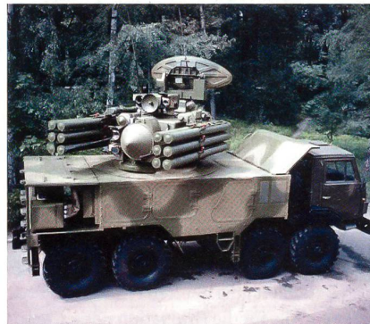
Modernes Fliegerabwehrsystem Panzir-S auf Geländelastwagen.

Die Truppen der russischen Luft- und Welt-raumabwehr sollen bis 2020 vollständig mit den Fla-Raketensystemen S-400, Panzir-S und Witjas ausgerüstet werden, wie das russische Verteidigungsministerium mitteilte.