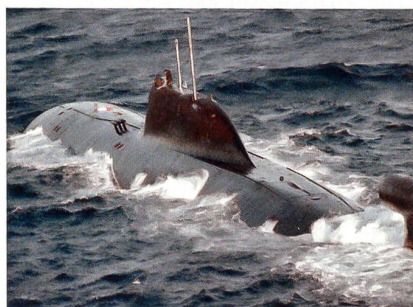
Russisches U-Boot «Schtschuka-B».

Die Vertragssumme beträgt mehr als 900 Millionen US-Dollar. Die Übergabe