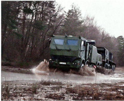
Das deutsche Bergefahrgeschäft Bison.

Die 13. Panzergrenadierdivision erhielt die Fahrzeuge, da sie ab Anfang 2012 als Leitdivision für die Ausbildung und