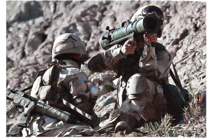
Infanteriebinom mit Carl Gustav M3.

Die US Army hat bei Saab für 31,5 Millionen US-Dollar Panzerabwehrwaffen des Typs Carl Gustav M3 für den Einsatz im Heer und bei den Spezialkräften bestellt.