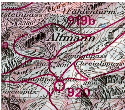
Aus der Karte 237 S Walenstadt.

Für den Skiwanderer bringen die neuen Karten einen hervorragenden Überblick mit den rot eingezeichneten Routen. Der hier abgedruckte Ausschnitt zeigt aus dem