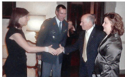
Festlicher Empfang in der Botschaft.

Unter der Schirmherrschaft des Vizepräsidenten des Istituto Affari Internazionali und ehemaligen Capo di Stato Mag-