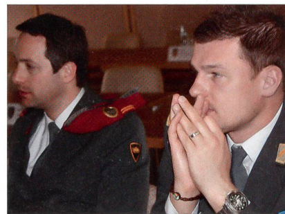
Rot und Gelb aufmerksam vereint.