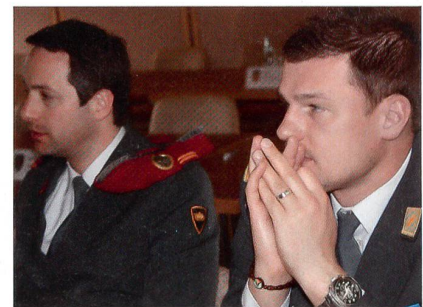
Rot und Gelb aufmerksam vereint.