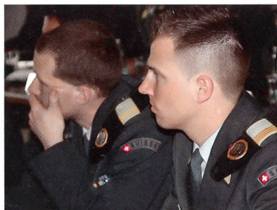
Gelb: In der Pz Br 11 eine starke Farbe.