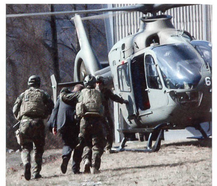
Der Botschafter wird zum Heli gebracht.