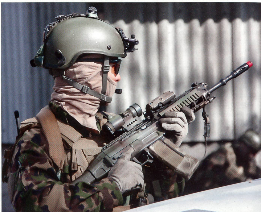
Aus operationellen Gründen stellt sich das AAD 10 den Fotografen nur maskiert.

Das Werkzeug Armee generiere vor allem dann einen Mehrwert, wenn es sein Auge im Sinne der Nachrichtenbeschaffung vorzugsweise bereits vor einer Eskalation einsetze und so die Handlungsfreiheit der