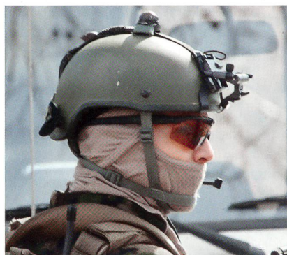
Maskierter AAD-Mann schützt die VIP.