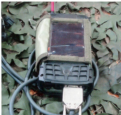
DATA-Terminal für SE-240.