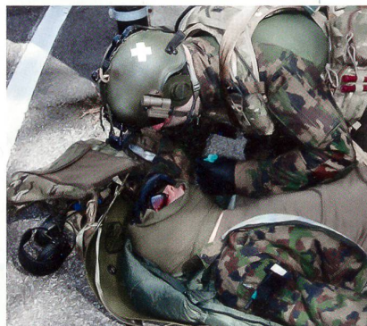
Ein Sanitäter leistet Erste Hilfe.