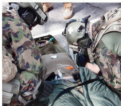
Hohe Schule: Ein Sanitäter setzt dem schwer verletzten Kameraden eine Infusion, der andere beobachtet ihn genau.