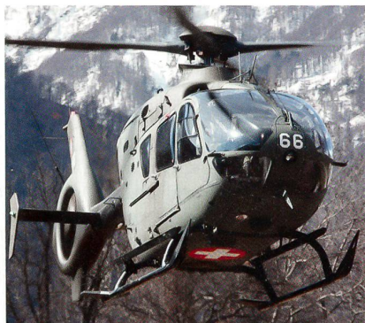
Der Heli bringt die VIP in Sicherheit.