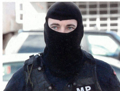
Er bleibt namenlos: Der Mann, der den Zugriff gegen die Bösewichte führte.