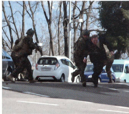
Nach Überfall wird die VIP gerettet.