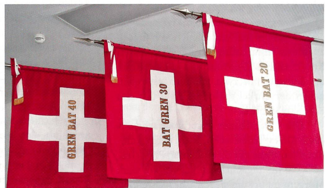
Die Feldzeichen der drei Grenadierbataillone 20, 30 und 40.