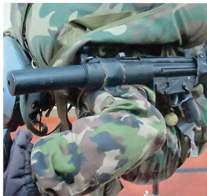
9-mm-Maschinenpistole HK5 SD.