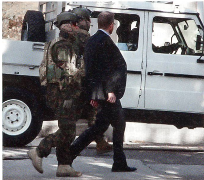
11 Uhr: Botschafter wird eng gedeckt.