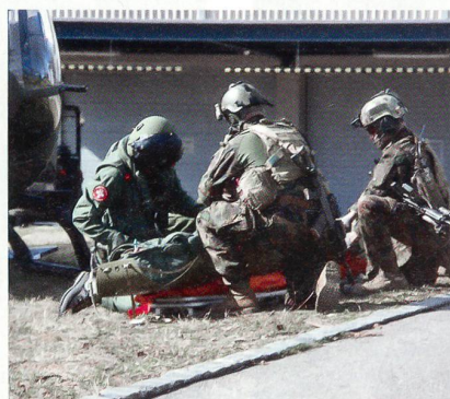
Nachdem die Sanitäter den Verletzten auf einer Wanne zum Heli geschleift haben, wird dieser auf eine Bahre geladen.