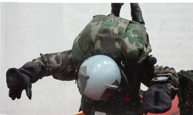
Zum Kommando Spezialkräfte gehören die Fallschirmaufklärer.

Ja, das mühsame politische Entscheiden müsste so zügig vorangehen, wie das KSK jeweils zuschlägt, fügt der beeindruckte Berichterstatter an. fo.