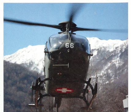
11.24 Uhr: Der Helikopter fliegt den Verletzten in Sicherheit. Die Übung wurde vorher nicht eingeübt!