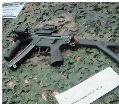
9-mm-Maschinenpistole HK5 kurz.