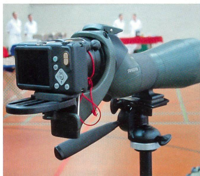
Bildaufklärung 08 klein.