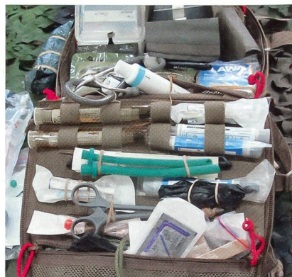
Medic Combat Trauma Pack.