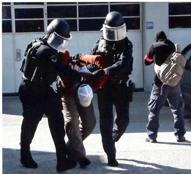
Die Militärpolizei führt die Kriminellen ab.