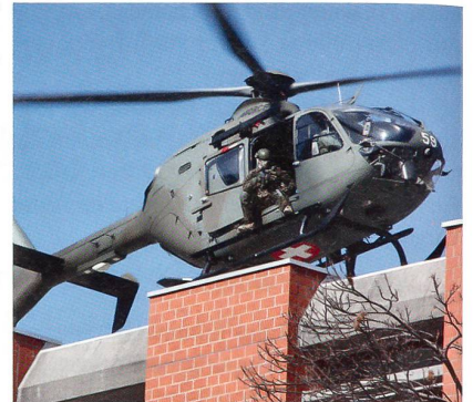
Ein EC-635 bringt Unterstützung.