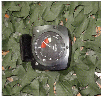
Altimeter für Fallschirmspringer.