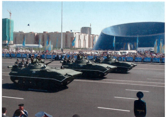
... hier auf einer der jährlichen pompösen Paraden.

erst am 16. Dezember 1991 vollziehen. In Alma Ata entstand sodann die Gemeinschaft Unabhängiger Staaten GUS. Ausschlaggebend dafür waren die Verflechtungen mit Russland, die Kernwaffen und das Raumfahrtzentrum Bajkonur.