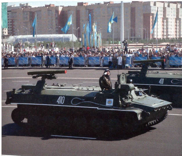
Bis auf die Zähne bewaffneter Staat ...