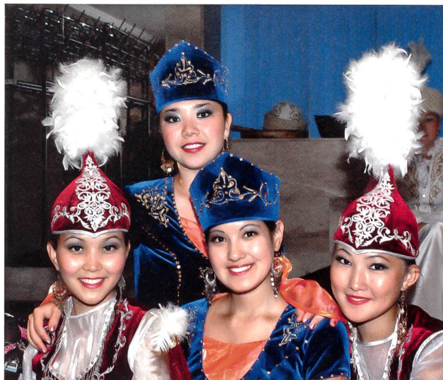
... und farbenprächtige, reiche Unterhaltung.