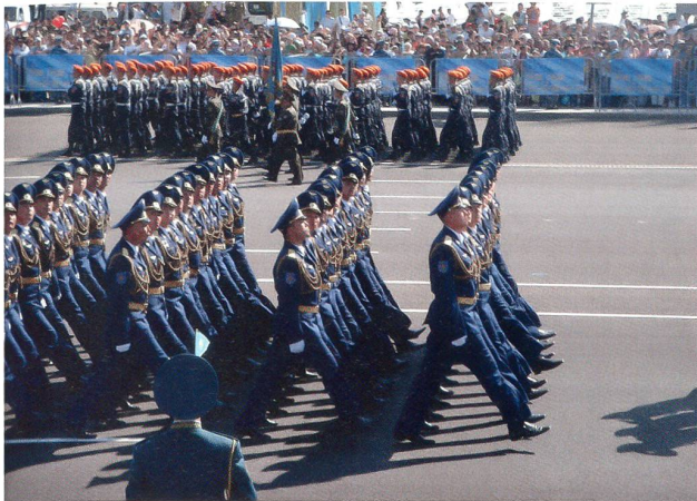
Zu Kasachstan gehören starke Streitkräfte ...