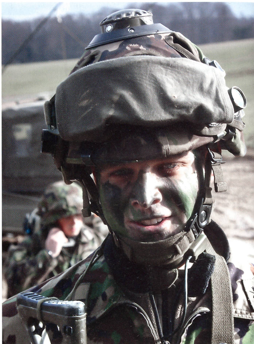
Ein Kompaniekommandant mit der Simulationsausrüstung.

Mit Videoaufnahmen werden innerhalb und ausserhalb der Gebäude Szenen festgehalten. Damit auch in der Dunkelheit geübt werden kann, sind die Innenkameras infrarotauglich und die Kameras ausserhalb der Gebäude haben eine Wärmebildfunktion. Zusätzlich stehen der Übungslei-