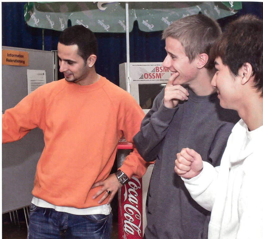
Am Berner Orientierungstag für angehende Rekruten: Wir sind alle Schweizer.

Warum gerade er? «Er war der einzige, der mir mein Gepäck zum Bahnhof trug», antwortet die Frau.