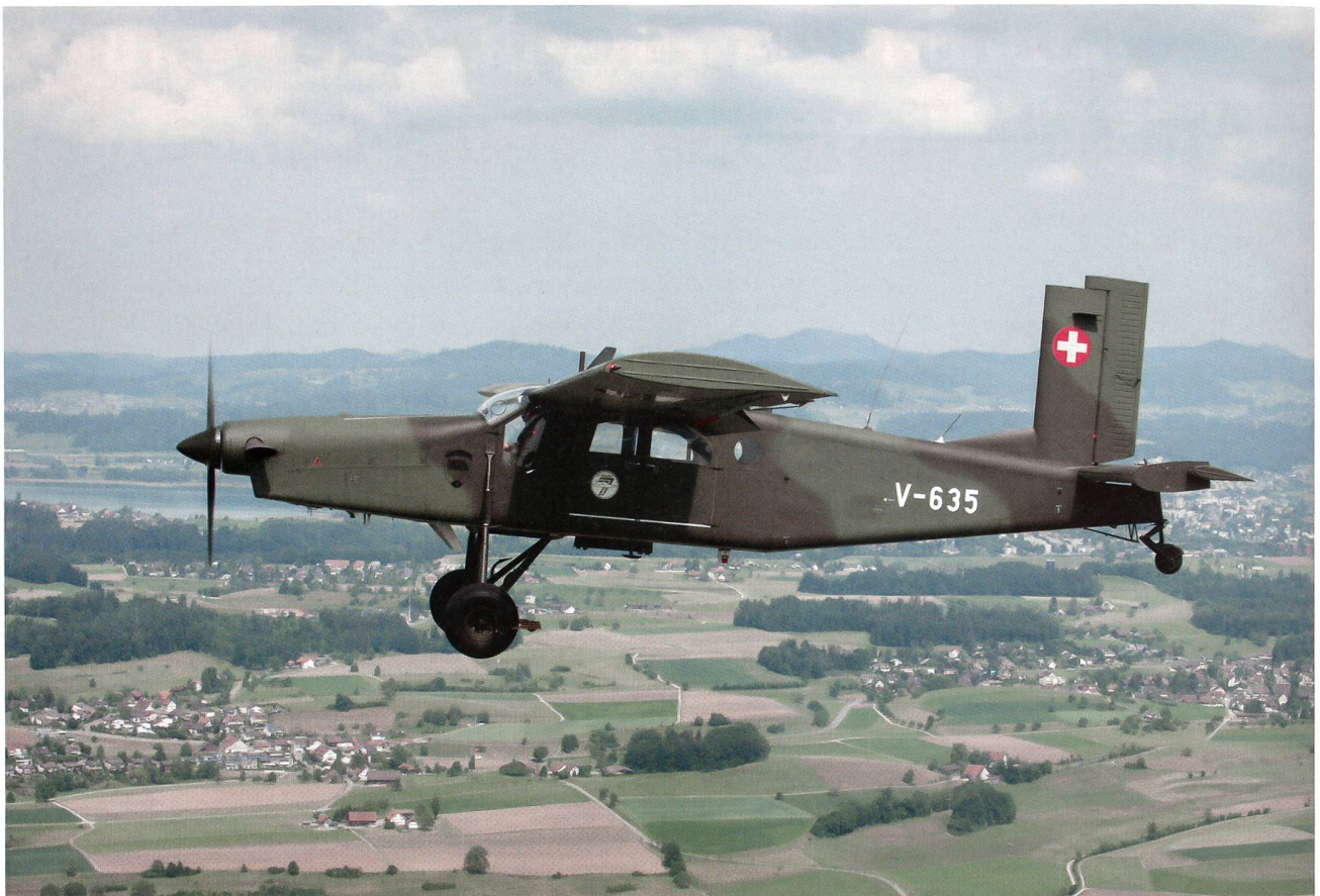
Der Porter fliegt weiter: Der Pilatus PC-6 mit der Nummer V-635 über der Schweiz.