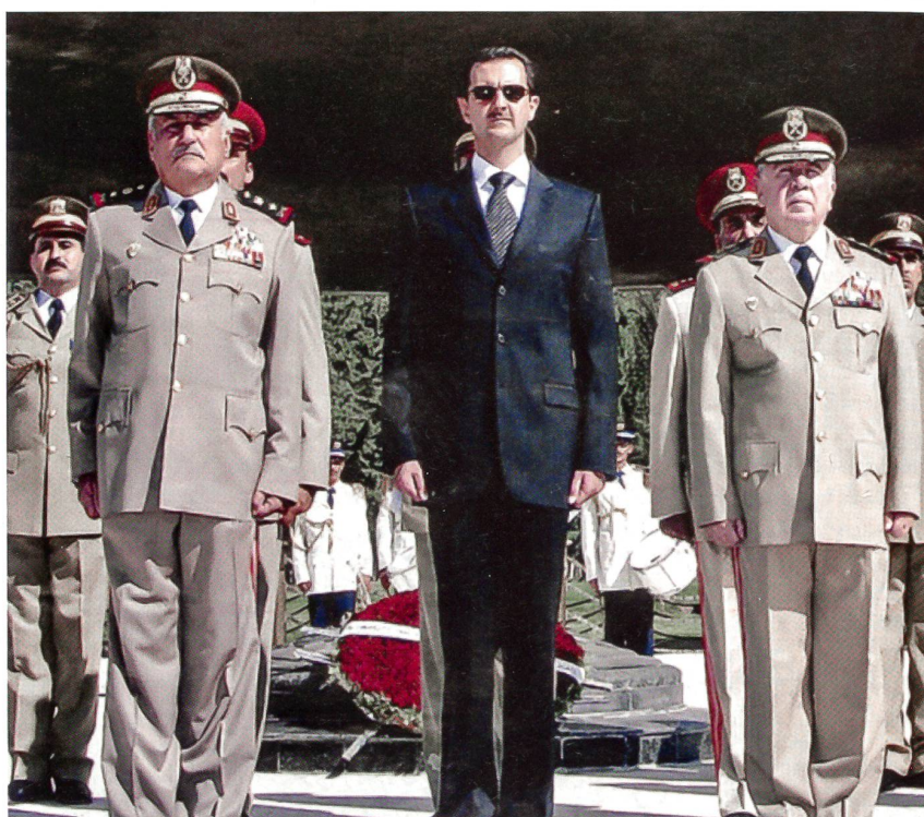
Grimmige Mienen in Damaskus: Der Diktator al-Asad mit seiner Militärführung.

Auch Bashar al-Asads Republikanische Garde, seit jeher eine der Elite-Gruppierungen der regulären Streitkräfte, ist vor Desertionen nicht mehr gefeit. Das Überlaufen