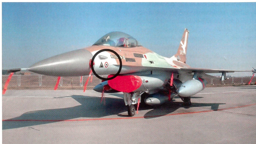
Eine F-16, die nach Bagdad flog, erkennbar am dunklen Dreieck auf dem Rumpf.

In der Planung und Organisation des Luftangriffs gilt es eine Reihe von Parame-