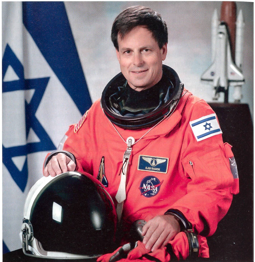
Einer der F-16-Piloten war der spätere Astronaut Ilan Ramon, der 2003 umkam.

Ob der Angriff innenpolitische Gründe – es stehen Wahlen in Israel an – hat, darüber wird ebenfalls spekuliert.