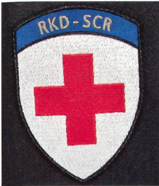
Der Badge, den die Angehörigen des Rotkreuzdienstes auf dem rechten Oberarm tragen.