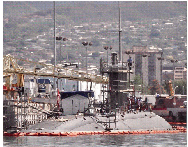
Am Jagd-U-Boot USS «Tucson» (SSN 770) werden im Hafen von Pearl Harbor Wartungsarbeiten ausgeführt. Auf der Hawaii-Insel sind mit 19 Einheiten am meisten Jagd-U-Boote stationiert.

Das geschieht in getauchtem Zustand des U-Bootes. Das ASDS fährt dann selbständig – immer noch untergetaucht – in Küstennähe und setzt die Seals ab. Nach erfolgter Mission kehren diese an Bord des ASDS zum U-Boot zurück.