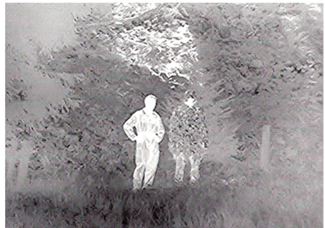
Nahaufnahme mit einer hochauflösenden Wärmebildkamera eines Standard-Kampfanzuges (links) und eines Infrarotoptimierten Kampfanzuges der Firma SSZ (rechts).

diese hohen Anforderungen zu erfüllen wird auch RAM (Radar-absorbierendes Material) verwendet. Bei diesen Lösungen braucht es die enge Zusammenarbeit des Fahrzeugherstellers und des Tarnspezialisten für das Signaturmanagement im Bereich Wärmebild. Die Führung des Abgasstrahls, das Isolieren der Abgasturbolader und das Managen der Motorlüftungssysteme bedingt meist auch Anpassungen am Fahrzeug selber.