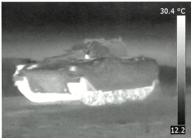
Nachtaufnahme eines KSpz mit einem SSZ-Tarn-Kit in Fahrt. Deutlich sieht man das heisse Fahrwerk, den Kopf des Fahrers und die Lampen.