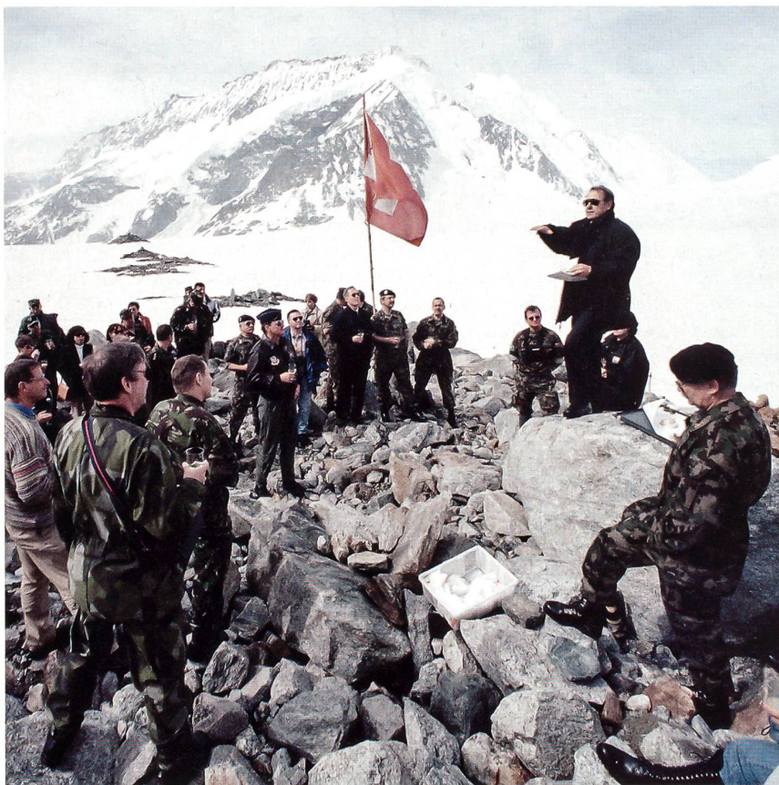
Ausflug mit den Verteidigungsattachés auf den Konkordiaplatz am Aletschgletscher.

siner Fernsehjournalist, der den neuen Nationalrat filmisch an die erste Sitzung begleitet: Achille Casanova, der spätere, langjährige Bundesratssprecher. Auch hier zeigt sich wieder: Die Schweiz ist klein und vielfältig. Abend für Abend nimmt Adolf Ogi acht Jahre später während des WK im Engadin an Wahlveranstaltungen teil, vor allem natürlich im Unterland. Man steht vor den Eidgenössischen Wahlen.