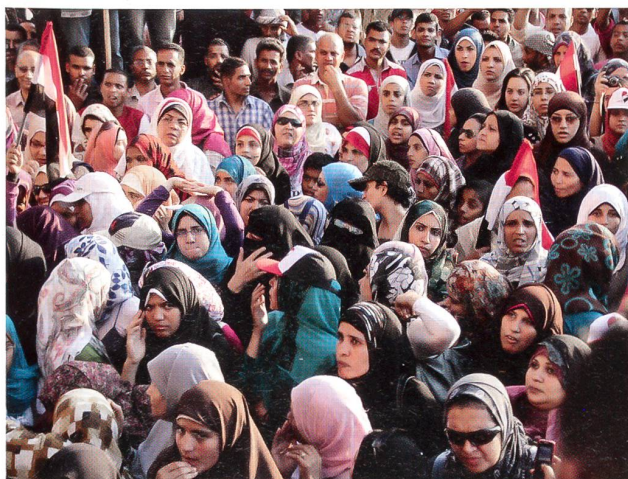
Muslimische Frauen in Kopftüchern.