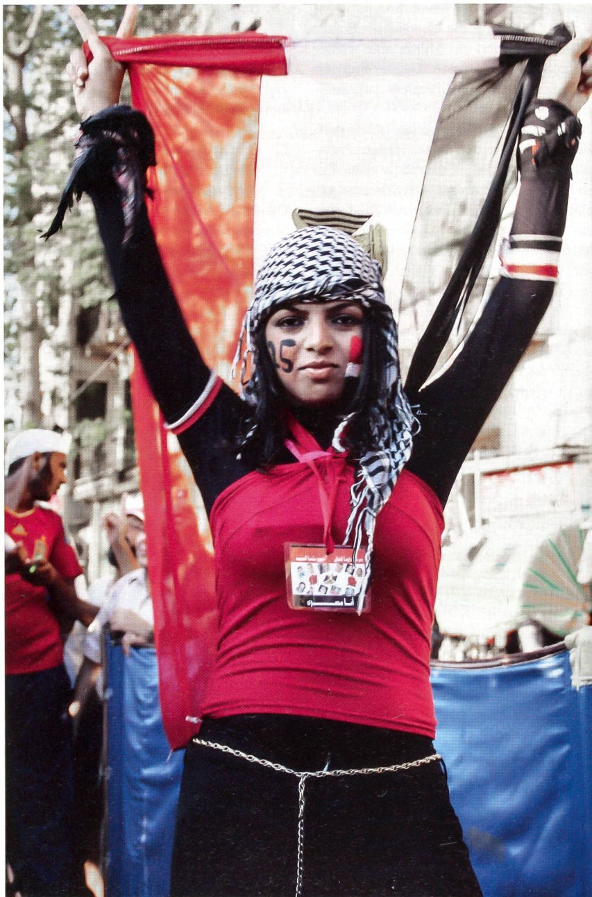
Die ägyptischen Frauen ringen um die Gleichstellung mit den Männern.

Eindrücklich war der letzte Tag, nach dem dann das Fasten gebrochen wird. Ich war