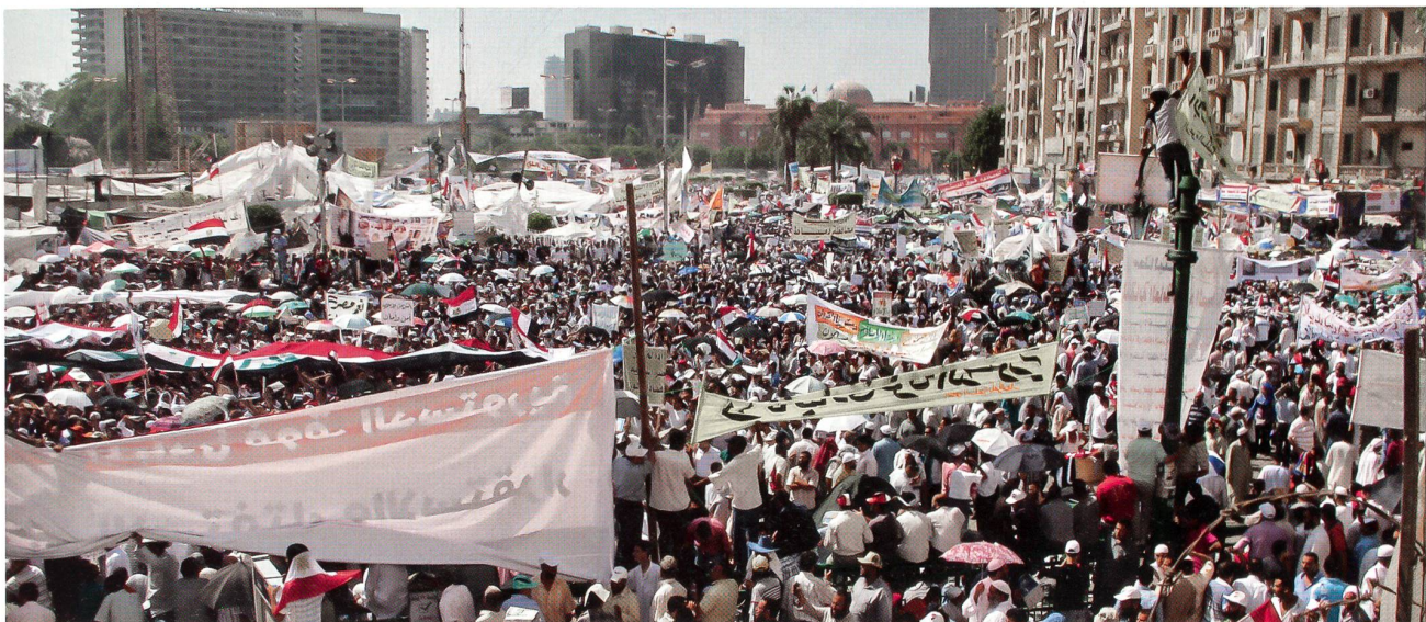
Grossaufmarsch auf dem Tahrir-Platz in Kairo: Zehntausende strömen zusammen.

Auch das ist möglich. Die USA dienen ja auch Israel als Schutzmacht. Und eine Kün-