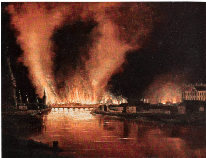
16. September 1812: Moskau brennt. Zar Alexander opfert die besetzte Stadt.

ihr Holz und ihr Getreide nicht mehr nach England aus. Gleichzeitig fehlen der russischen Einfuhr die englischen Kolonial- und Industriegüter.