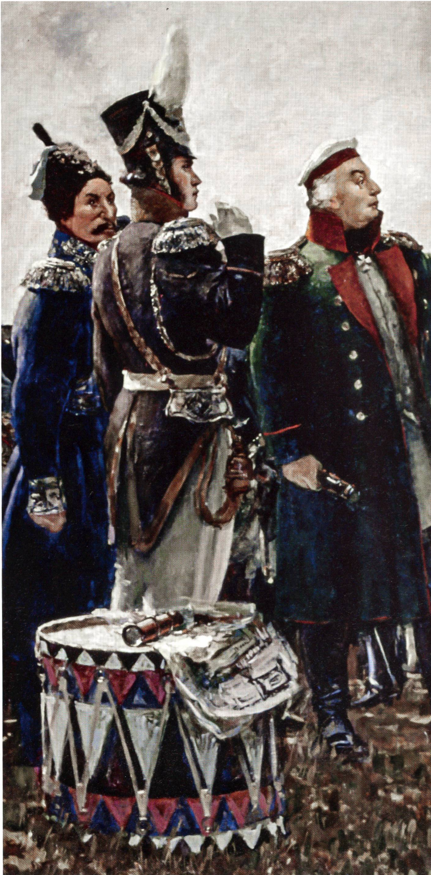
Borodino: Der russische Heerführer Michail Kutusow im grünen Generalsmantel.

sprengen – doch die Zünder versagen, und die mächtige Festung bleibt stehen. Jetzt ist Napoleon Bonaparte erstmals in seinem Leben der Gejagte, nicht mehr der Jäger.