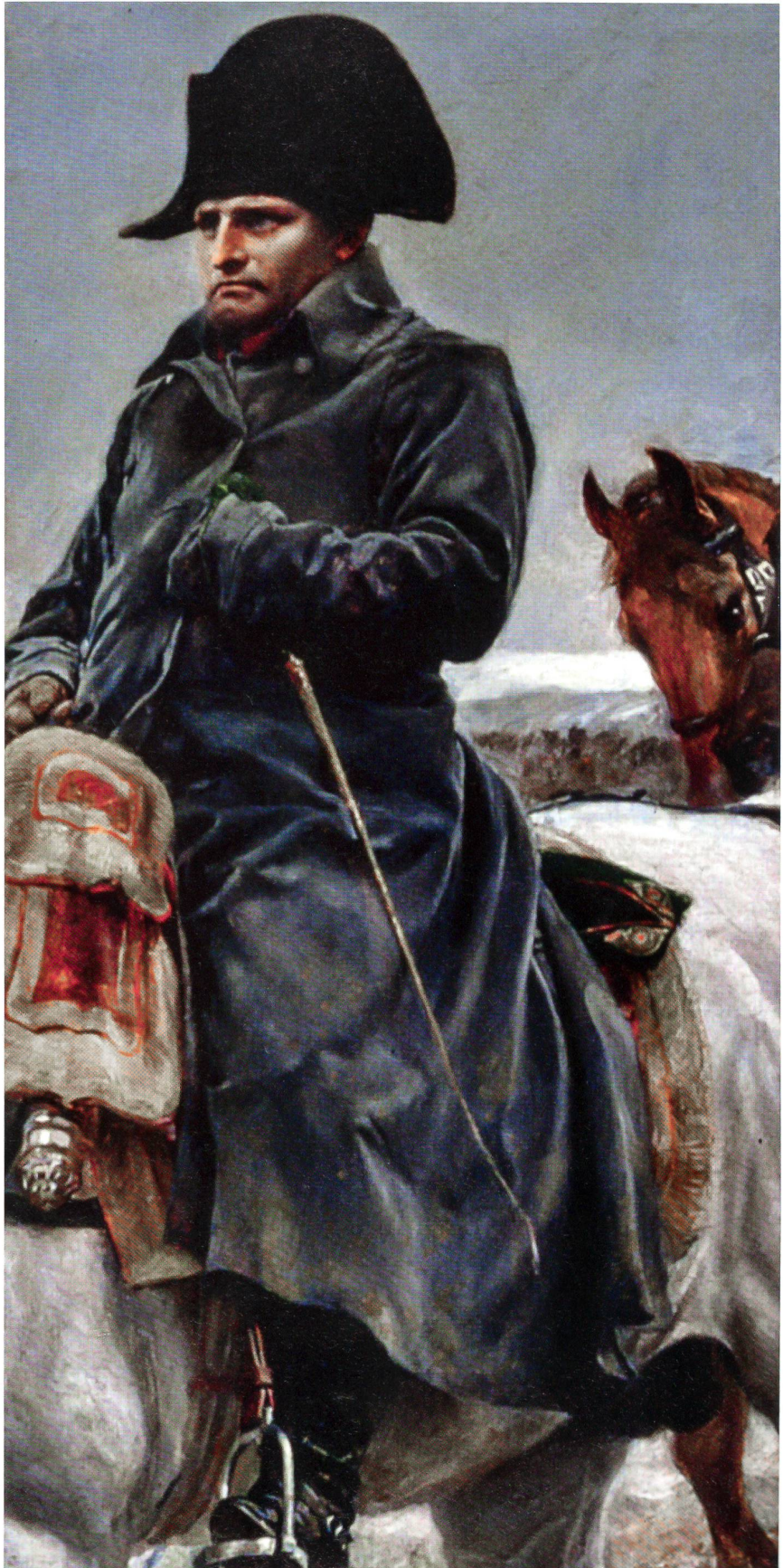
Napoleon in der Pose des unbezwingbaren Heerführers. Doch das Bild täuscht!

Am 30. November sinkt die Temperatur auf minus 30 Grad. Die Grosse Armee ist nur noch ein Haufen zerlumpter und ausgehungertes Männer. Napoleon sucht von seinen strategischen Fehlern abzulenken und schiebt den Untergang seiner