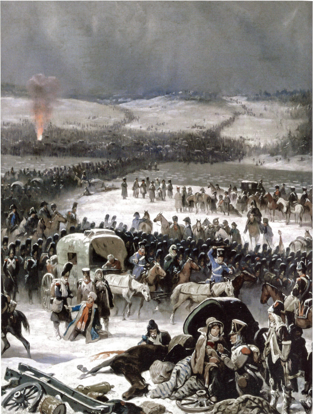
Über Behelfsbrücken suchen sich die Reste der Grossen Armee über die Beresina zu retten, angegriffen von der russischen Armee.