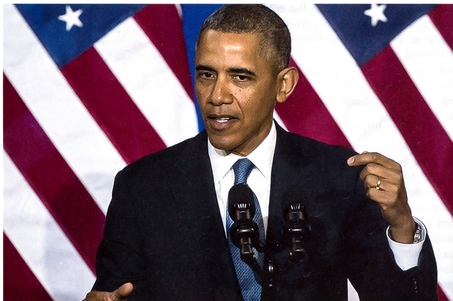
Am 18. Juli 2014 hält Präsident Obama im Weissen Haus seine Rede zu MH17.

Das ist nicht das erste Mal, dass ein Flugzeug über der Ost-Ukraine abgeschossen wurde. In den letzten Wochen schossen