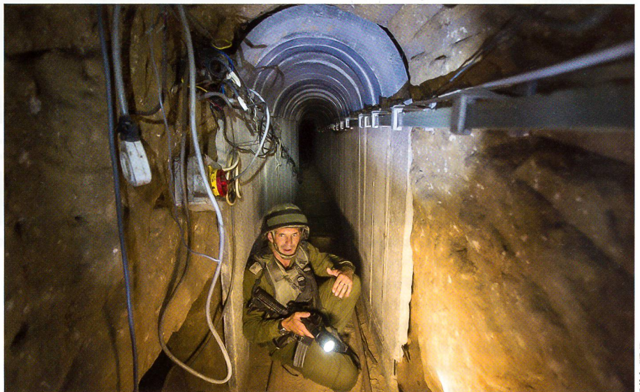
Ein israelischer Major und Sprengmeister in einem 400 Meter langen Tunnel.

Der Geheimdienst weiss: Es ist die libanesische Hisbollah, welche die Hamas im Tunnelbau anleitet. Und es ist die Hisbollah, die den dritten Libanonkrieg vorbereitet. Mehrere Grossverbände suchen die Angriffstunnels, die das Leben der nahen Kibbuzbewohner zur Hölle machten. Wenn die