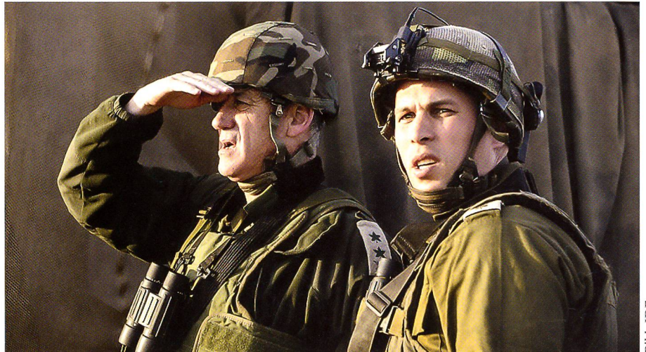
Generalstabschef Benny Gantz an der Gazafront mit einem Bataillonskommandanten.

N: Ja, die Terroristen nahmen den Krieg mit rund 15 000 Mann auf. Von unserem Nachrichtendienst wissen wir, dass mehr als 1000 getötet wurden. Das belegt: Der Anteil der getöteten Terroristen an der Gesamtzahl von 1360 Opfern, welche die Hilfswerke melden, fällt hoch aus. Die Zahl der israelischen Kämpfer beläuft sich auf rund 86 000 Mann. Wir mobilisierten Re-